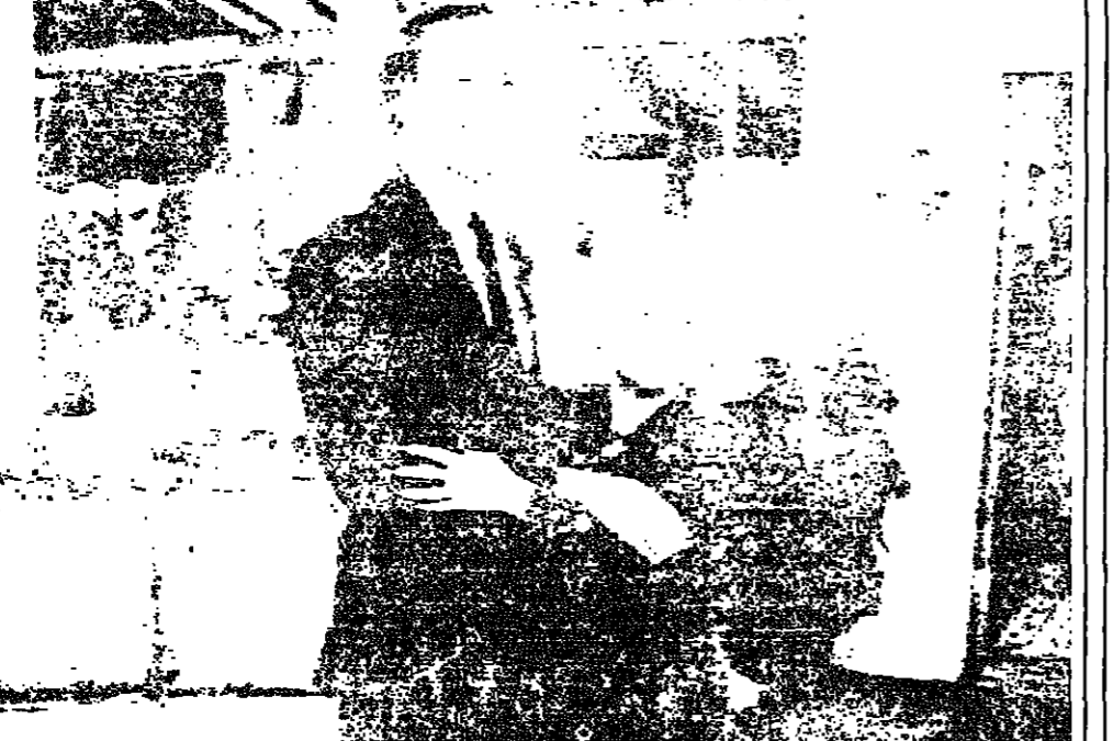
المغني خوليو اينغليساس والممثلة ايسلر غيتي لدى وقوفهما في ٣ الجاري أمام المصورين، وذلك عقب قيام خوليو بأول دور تمثيلي له وكان ذلك في حلقة من حلقات غيتي في موعد غرامي. موليبيود - ر